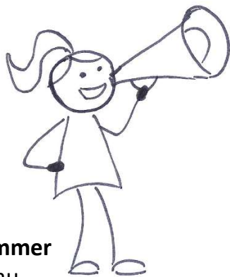
Tina Sommer Obfrau